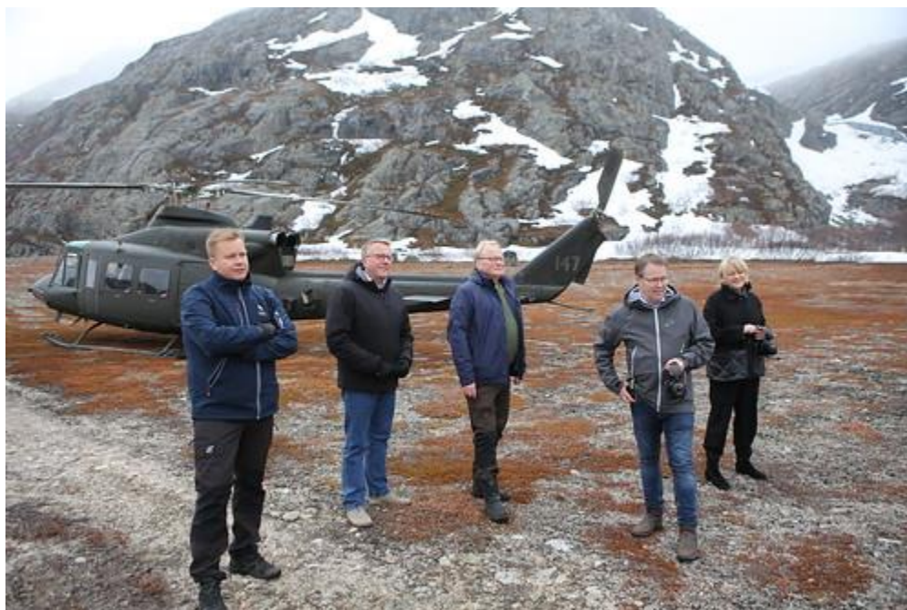
Nordefcos försvarsministermöte i Kirkenes

De nordiska ländernas försvarsministrar beslutade i maj 2022 vid sitt möte i Kirkenes i Norge att inleda en reform för att anpassa Nordefco till den förändrade omvärlden. Riktlinjerna för reformarbetet behandlades under hösten och vid sitt möte i november beslutade försvarsministrarna om utarbetandet av en ny vision för Nordefco, och att samarbetets struktur och processer ska ses över och anpassas. I framtiden blir operativt och förmågesamarbete allt viktigare. Det är viktigt att det nordiska samarbetet i framtiden stöder och kompletterar Nato. De nordiska länderna ser Nordefco som en fungerande plattform för att utveckla försvarssamarbetet, och arbetet fortsätter under Sveriges ordförandeskap år 2023.