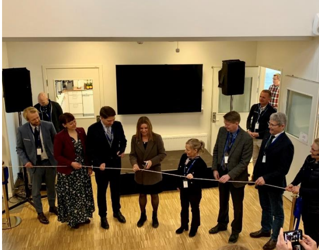
Invigning av Nordgens nya byggnad