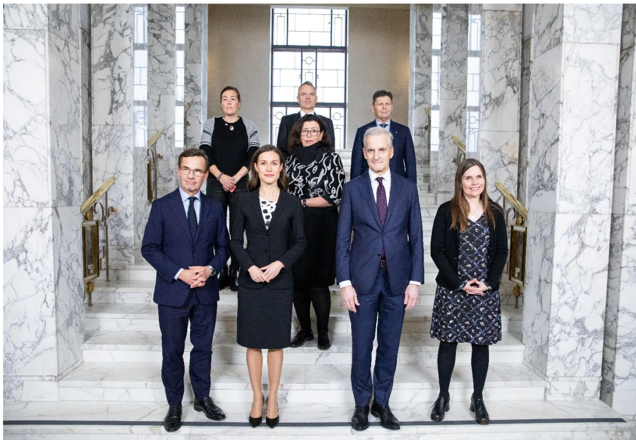
De nordiska statsministrarna på riksdagens marmorsteg under sessionsveckan i november 2022