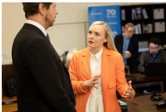
Miljöministrarna möts i samband med Nordiska rådets session i Helsingfors.