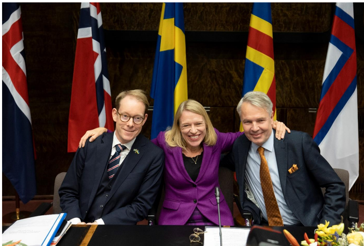
Sveriges, Norges och Finlands utrikesministrar under sessionsveckan i Helsingfors i november

Det nordiska samarbetet i FN är speciellt synligt till exempel i klimat-och jämställdhetsfrågor. År 2022 var Norge ordförande för det nordiska N5-samarbetet. Under årets lopp hölls flera virtuella möten och utrikesministrarna möttes för sitt sommarmöte i Bodö i juni. Finland var år 2022 ordförande för Nordiska rådet och under höstens session hölls utrikesministrarnas möte i Helsingfors i november. Rysslands anfallskrig mot Ukraina har varit det viktigaste ämnet under årets möten, men även Nato var ofta på agendan i och med Finlands och Sveriges Nato-ansökningar.