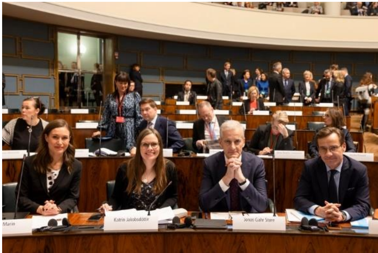
Nordiska statsministrar under sessionsveckan i Helsingfors i november 2022