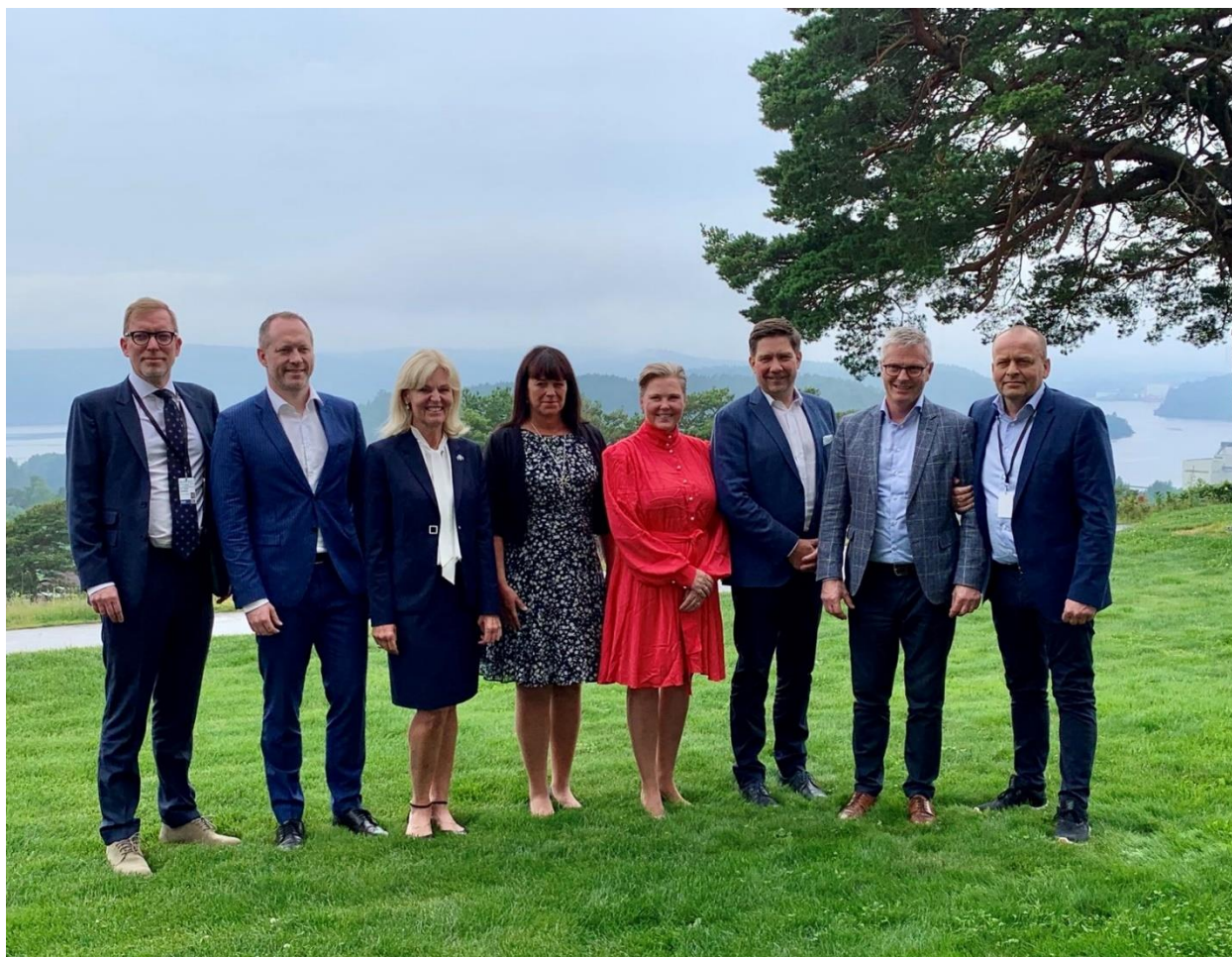
Nordiska samarbetsministrar vid sommarmötet i Halden, Norge, juni 2022