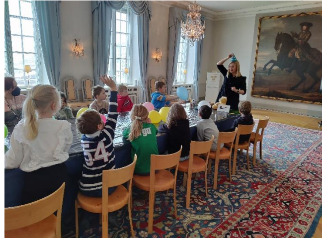
Svenska nu anordnade en ordförandsworkshop för elever i språkfördjupning på svenska ambassaden